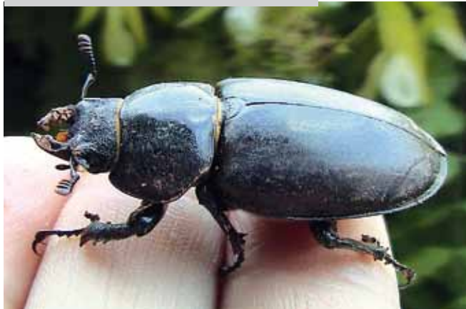
Adultes Hirschkäferweibchen, Größe: 3 - 5 cm